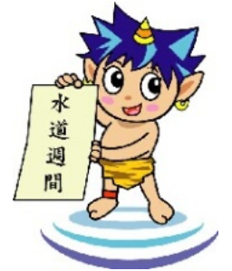
スイッキー 別府市水道局公式キャラクター