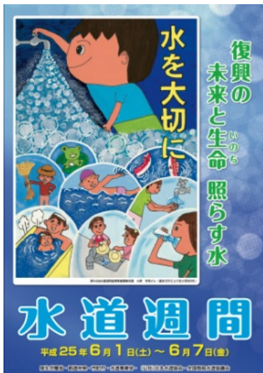
第55回 水道週間ポスター

水道について国民の理解と関心を高め、公衆衛生の向上と生活環境の改善を図るとともに、水道の今後の発展に役立てるため、厚生労働省が昭和34年度に設けたもので（今年で55回目になります）毎年6月1日から7日までの1週間実施されています。