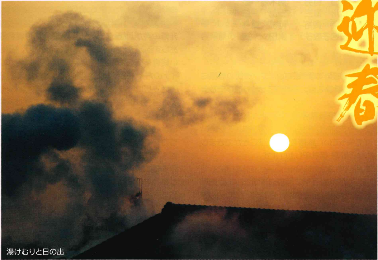
湯けむりと日の出