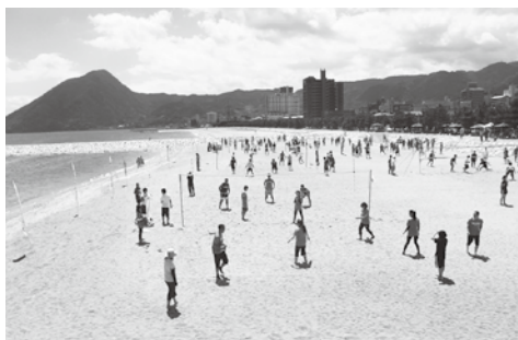
昨年度のビーチバレーボール大会の様子

委員は、学識経験者、地域住民、ビーチスポーツ等の関係者を含む海岸関係各種団体、海岸関係の行政関係者等を予定しております。