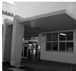
施設改修が完了した「野口ふれあい交流センター」

答 問題意識を共有して新しい発想で対策を考えることは必要。今後の検討課題としたい。