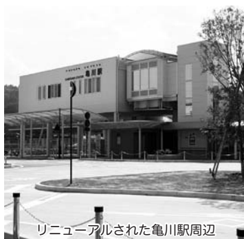
リニューアルされた亀川駅周辺

答 国のまちづくり交付金事業から都市再生整備計画事業と名称変更となつて亀川地区の整備を進める。地元の声を集め、市で計画案を策定確認のうえ国へ送り、平成25年度から29年度の5か年計画を予定している。