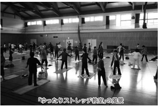
「ゆったりストレッチ教室」の風景

答 ありがたい指摘を頂いた。「ゆったりストレッチ教室」は、市民の健康づくりに大変貢献している。今後は「ゆったりストレッチ教室」を拡大して介護予防を真剣に考えたい。