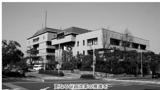
更なる行政改革の推進を