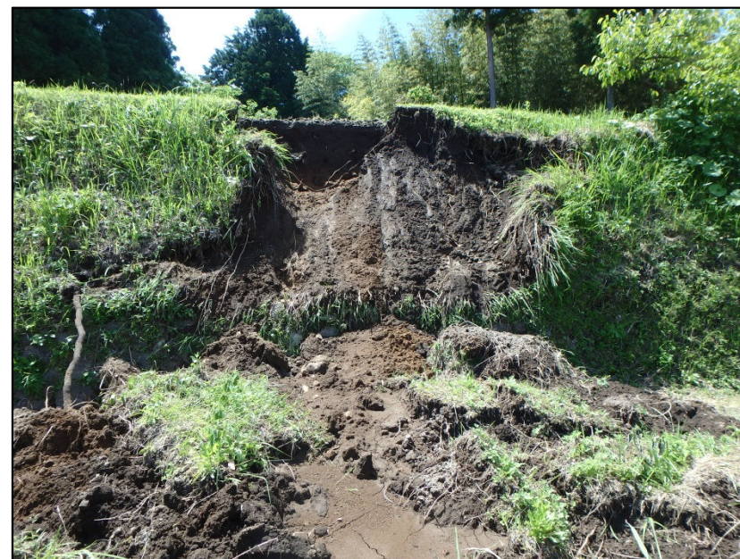
椿の被害状況(H27.7.2撮影)