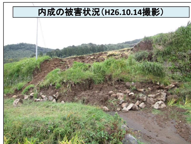
内成の被害状況(H26.10.14撮影)