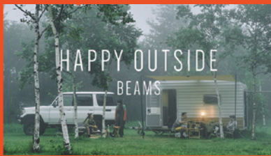
▼市内プロモーション動画撮影時の様子