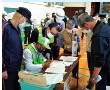
感染症対策を盛り込んだ避難所運営訓練

小・中学生の登下校時にあいさつ運動や交通安全指導などを行っています。また、避難所運営や災害時に必要な防災資機材を整備することで、安心安全なまちづくりを目指します。