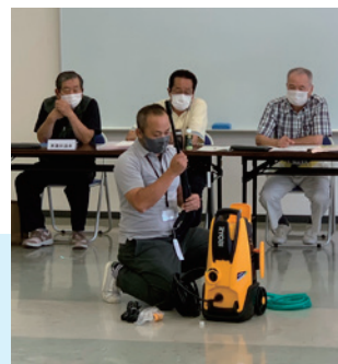
温泉部会で高圧洗浄機の研修を受けました。

地域の困りごとの解決や魅力あるまちづくりに向けて、話し合いを重ねています。また、共同温泉の課題に取り組む部会を立ち上げた協議会や拠点となる事務所を開設した協議会など、組織力の強化を図っています。