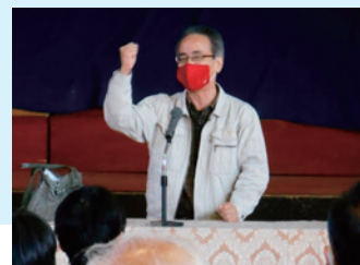
講演会を実施し、地域づくりについて学びます。