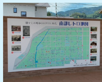
地域の歴史を紹介する看板を設置