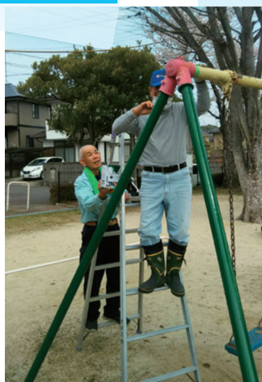
老朽化した公園の遊具を修繕しました。