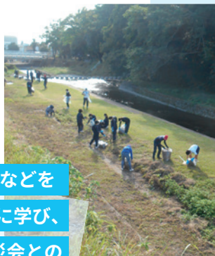
河川敷の清掃活動

農業体験や清掃活動、講演会などにより、地域の自然保護と環境美化、地域住民の交流の場をつくります。