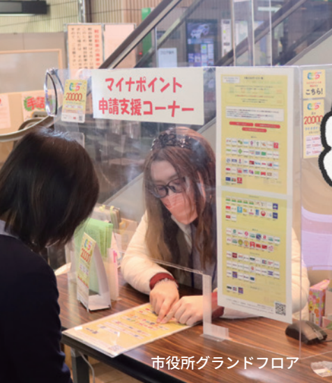
市役所グランドフロア