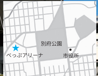
▲集団接種会場 (べっぴアリーナ)の地図