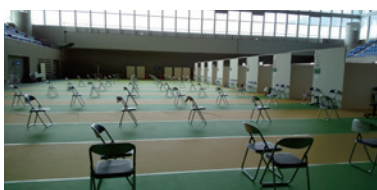
⑤ワクチン接種・体調観察