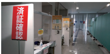
⑥接種済証のお渡し