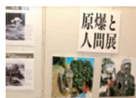
▲パネルのイメージ

証言を組み合わせて制作された「証言パネル」です。地域や学校での平和学習などに活用してください。