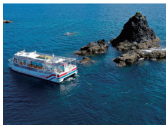
観光船ユメカイナ