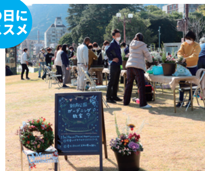
前回のガーデニング教室の様子