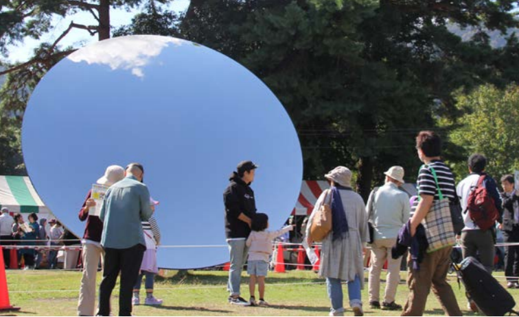
「第33回国文化祭・おおいた2018、第18回全国障害者芸術・文化祭おおいた大会」を開催しました(10月～11月)。