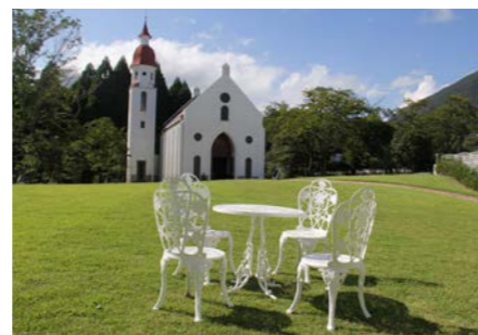
別府市初の婚活応援事業第1弾「べっぴん恋来40♥40」を開催(8月)。