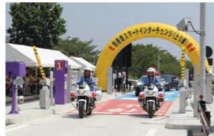
別府湾スマートIC上り線が開通(8月)。