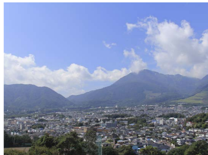
限りある温泉資源の持続的利用を図るため、「別府市温泉発電等の地域共生を図る条例」を改正し、温泉開発の規制を強化しました(10月施行)。