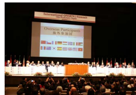
世界16か国の温泉地が参加した「世界温泉地サミット」を開催(5月)。