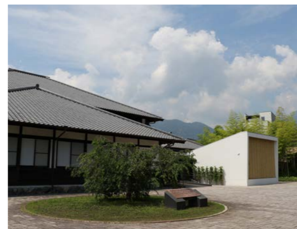
竹細工伝統産業会館がミュージアムショップ増築など建設以来初めてのリニューアル(3月)。

平成30年もあとわずか。今年の別府市は、ラグビーワールドカップ2019™公認チームキャンプ地決定のほか、温泉資源の保護や観光振興財源の確保に向けた取組など、将来に備えた戦略的な取組を行った年でした。皆さんにとって今年はどうな一年でしたか。