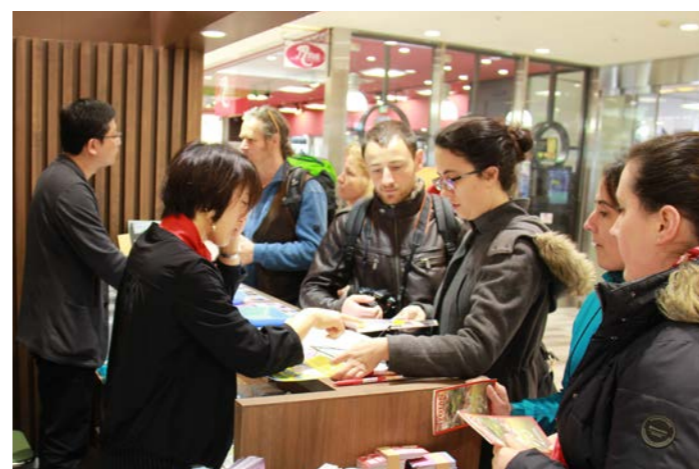
観光振興などの安定的な財源確保のため、平成31年4月1日から41年振りの入湯税引上げを決定。