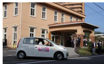
亀川出張所が北部コミュニティセンターに移転(9月)。