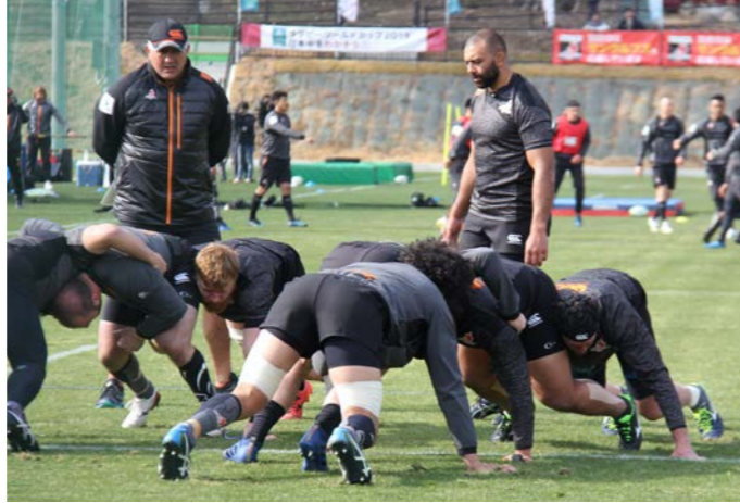
スーパーラグビーに参戦する「サンウルブズ」が1月28日から6日間、別府市でプレシーズン合宿を行いました。