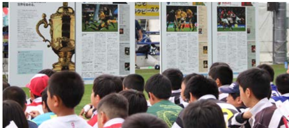
▲ 5月13日のラグビーフェスティバルでキャンプ地に内定したチームの紹介を行いました

4月20日、ラグビーワールドカップ2019組織委員会から、大会期間中に出場するチームが滞在する「公認チームキャンプ地」の内定状況が発表され、別府市は「ニュージーランド」「オーストラリア」「ウェールズ」の公認チームキャンプ地に内定しました。今後、組織委員会との間で公認チームキャンプ地契約を締結することで正式な決定となります。