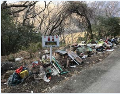
▲山道沿いの不法投棄現場

【平成31年4月採用 別府市職員採用試験 その他の区分・職種】については、市報9月号に掲載予定です。(8月下旬募集開始、10月試験実施予定)