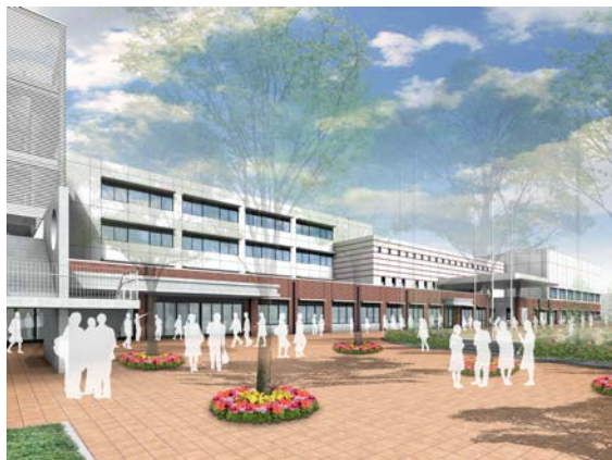
統合中学校完成予定図