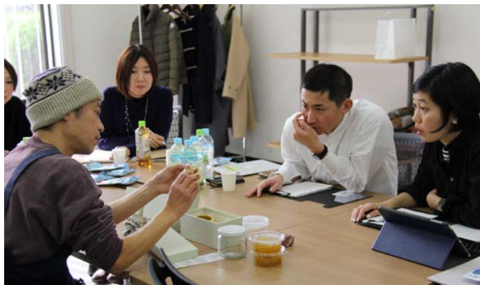
▲ビームス ジャパンのバイヤーと事業者（左）のサンプルチェックの様子