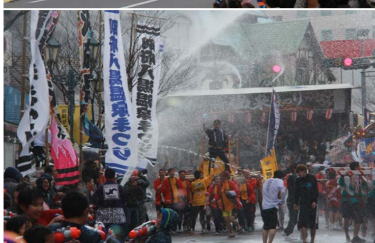
別府八湯温泉まつり「湯～Y o u～パレード」「湯・ぶっかけまつり」