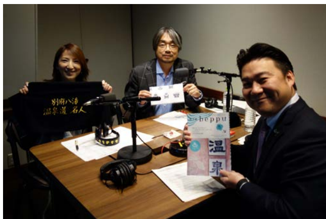
▲放送作家・脚本家の小山薫堂さんがパーソナリティを務める TOKYO FM 制作「ジャパモン」で、「BEAMS EYE on BEPPU」を紹介。民放各局で放送されました。