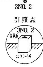
復元の与点 (世界測地系による座標) 都市再生街区三角点