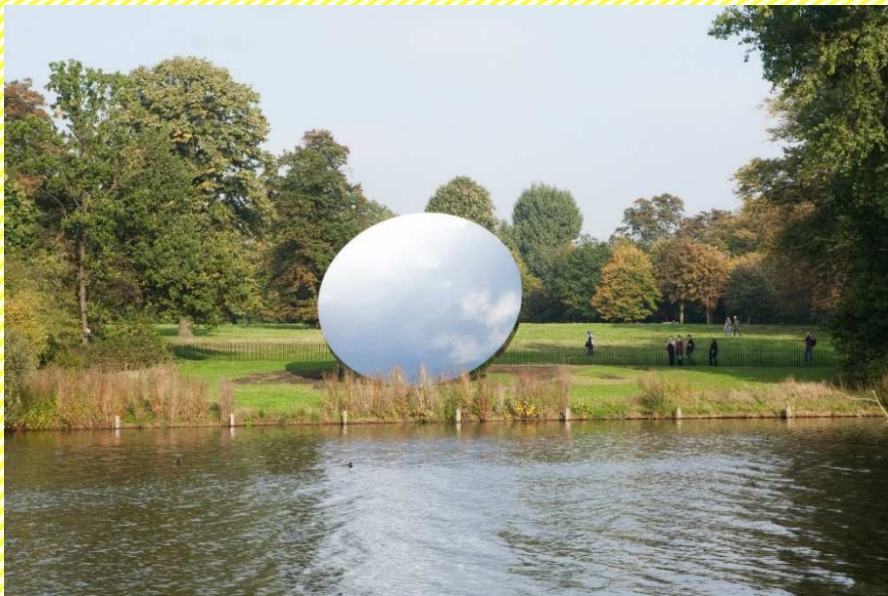
Sky Mirror, 2006 Stainless steel Diameter 10 m Photo: Seong Kwon Photography © Anish Kapoor, 2018

カプーア氏の代表作の一つ『Sky Mirror』(直径5m、ステンレス製)を設置。光を反射し空を映し続けるその姿は、あたかもこの場所にポツカリと突然空いた異世界への入り口のように見えるだろう。