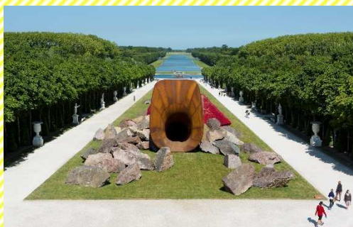
Dirty Corner, 2011-2015 Mixed media Dimensions variable Château de Versailles 2015 © Anish Kapoor, 2018

ヴェルサイユ宮殿での大規模な個展 野外に巨大彫刻が5点、屋内に作品が1点設置され、大規模な個展として多くの話題を呼んだ。