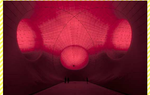
Leviathan, 2011 PVC 33.6 x 99.89 x 72.23 m Monumenta 2011, Grand Palais, Paris © Anish Kapoor, 2018

第33回国民文化祭・おおいた2018 / 第18回全国障害者芸術・文化祭おおいた大会