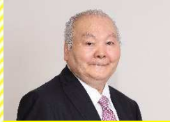
加藤 一三 九段 特別出演！(13日)

10. 12(金)～10. 14(日) 別府市公会堂、JR 別府駅構内及びその周辺