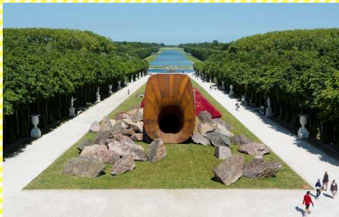
Dirty Corner, 2011-2015 Mixed media Dimensions variable Château de Versailles 2015 © Anish Kapoor, 2018

リヴァイアサン バリのグラン・パレで披露された巨大な 球状の作品。旧約聖書に登場する巨大な 海獣をモチーフとしており、鑑賞者は作 品の中に入ることもできる。