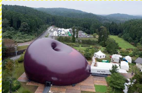
Ark Nova, 2013 PVC 18 x 29 x 36 m Matsushima, Japan, 2013 © Anish Kapoor, 2018