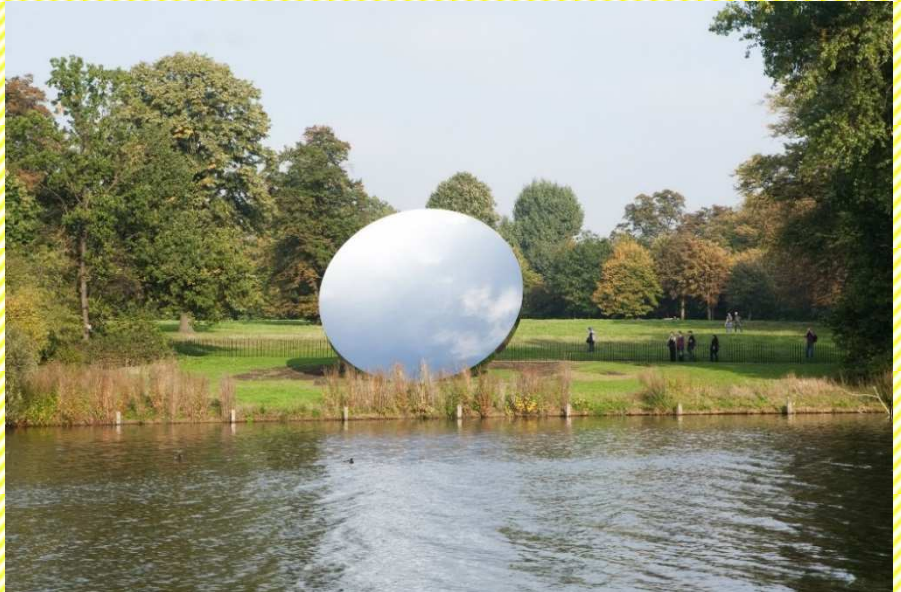
Sky Mirror, 2006. Stainless steel Diameter 10 m © Anish Kapoor, 2018

カプーア氏の代表作の一つ『Sky Mirror』(直径5m、ステンレス製)を設置。光を反射し空を映し続けるその姿は、あたかもこの場所にポツカリと突然空いた異世界への入り口のように見えるだろう。