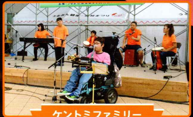
ケントミファミリー

オープニングイベント(13:30より)に 優しい歌声と旋律の2人組 「アルケミスト」が 登場します