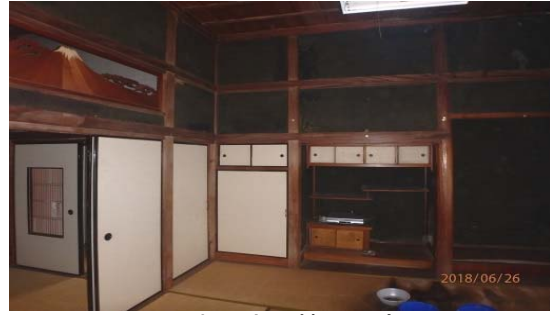
古民家風情の和室