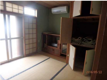
1階 和室 5.5帖