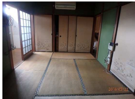
1階 和室 6帖