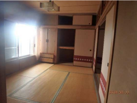
2階 和室 6帖