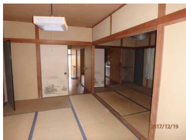
和室 2、和室 1