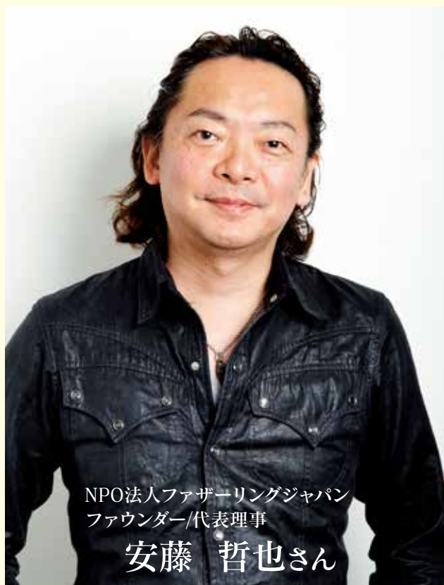
NPO法人ファザーリングジャパン ファウンダー/代表理事