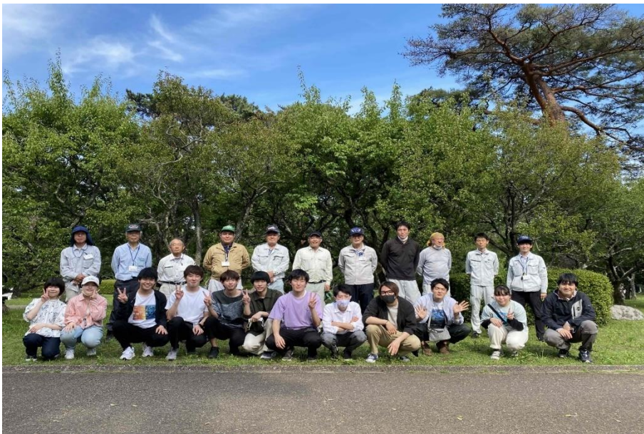
※写真の為に一時的にマスクをはずしています。