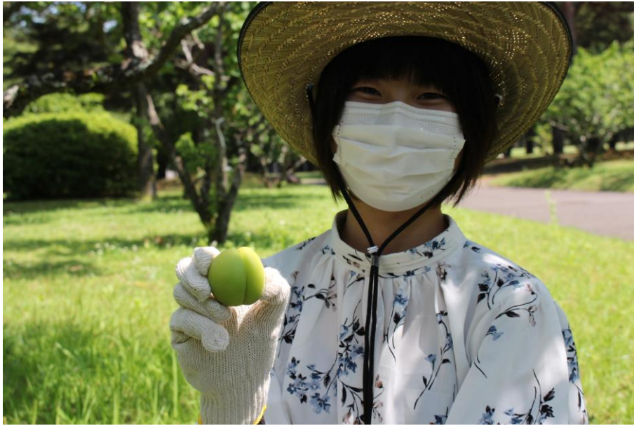
大粒の梅の実が生っていました