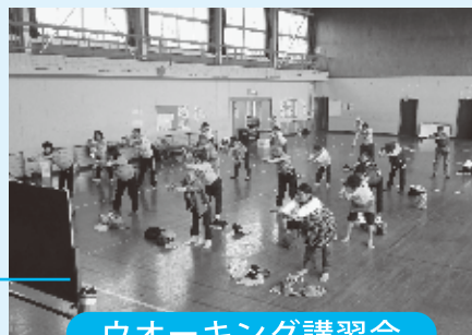
ウオーキング講習会