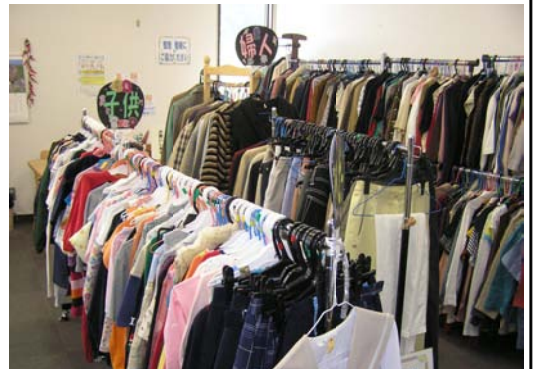
リユースコーナー内の模様

あなたが不用なものとなっても誰かが必要とされているかもしれません。市民の皆さまのご利用をお待ちしております。