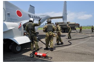
駐機・燃料補給・整備等