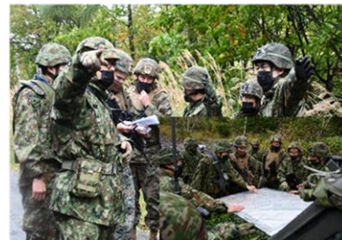
対着上陸戦闘訓練