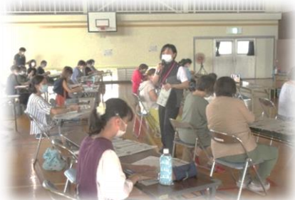
昨年度の講座の様子