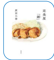
『定食屋「雑」』 原田/ひ香 || 著 (913.6/ハラ)

初夏秋冬の花の絶景を見て読んで訪ねて楽しめるガイドブック。文化と歴史ある神社とお寺で感じる四季。美しい写真で紹介し、お出かけに役立つ情報を掲載する。