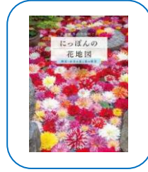
『にっぽんの花地図』 はなまつぶ || 著 (291/ハナ)

ことばの窓からどんな景色が見える? 例えば「モーングータ」とは月が水面に映し出す銀色の道。さまざまな言語から集めた不思議な自然のことばをイラストとともに収録する。