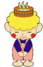
3月の図書館カレンダー