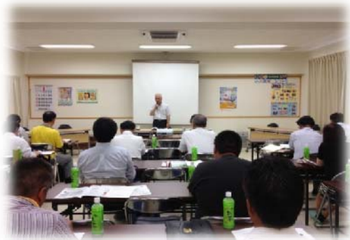
2012年度大分県隣保館連絡協議会第1回職員研修会

森永乳業の社会貢献事業により2人の講師をお招きして、牛乳を使った「ザーサイご飯のふわふわ淡雪・にんじんのポタージュ・クリープパンナコッタ」を調理しました。『牛乳や骨粗しょう症』に関するお話をいただいたあと、女性の人権問題に関するビデオ研修を行いました。