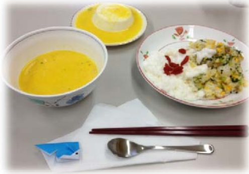
第3回人権サークルふれあい

森永乳業の社会貢献事業により2人の講師をお招きして、牛乳を使った「ザーサイご飯のふわふわ淡雪・にんじんのポタージュ・クリープパンナコッタ」を調理しました。『牛乳や骨粗しょう症』に関するお話をいただいたあと、女性の人権問題に関するビデオ研修を行いました。