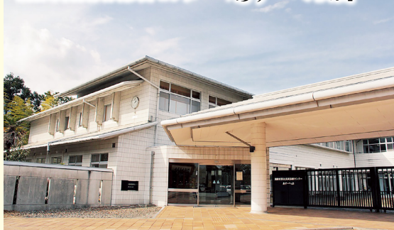
別府市男女共同参画センター「あす・べっぴ」