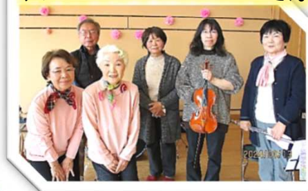
アンサンブルふじおかのみなさん

オープニングの「四季の歌」から、生演奏と歌で、ほっこりとした和やかな時間を過ごしました。最後はアンコールで「故郷」を参加者も一緒に唄い、胸いっぱいになりました。