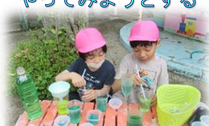
自分なりに考え、やってみようとする