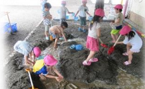
じっくり取り組む集中力