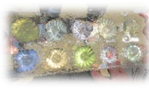
試行錯誤を繰り返す