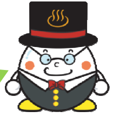
“베피시 건강만들기 계획 음식교육 추진계획” 온천마을베피시 건강21 이미지 캐릭터