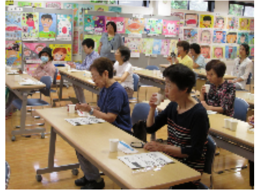
'와쿠와쿠 건강만들기 교실' 2014년6월 '이의 이야기'

벋푸시 건강만들기 추진과에서는 한달에 한번씩 주제를 갖고 건강교실/건강상담회 '와쿠와쿠 건강만들기 교실'을 열고 있습니다. 주제는 매달 벋푸시 광보지에 게재됩니다. 진단결과를 가지고 참여해주시길 바랍니다.