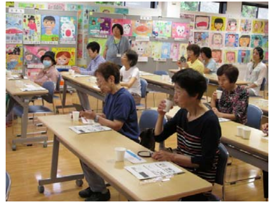
『快樂健康教室』 2014年6月 關於牙齒的話題

別府市健康保健課每月都舉辦1次名為『快樂健康教室』的主題健康教室・健康座談會。每個月的主題將刊登在市報上。請大家務必帶上自己的健康檢測結果來參加健康教室。