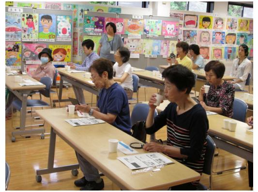
『快乐健康教室』 2014年6月 关于牙齿的话题

别府市健康保健课每月都举办1次名为『快乐健康教室』的主题健康教室·健康座谈会。每个月的主题将刊登在市报上。请大家务必带上自己的健康检测结果来参加健康教室。