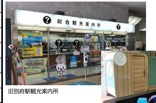
旧別府駅観光案内所