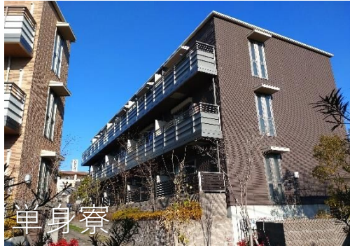
会社隣り、Wifi完備で機能充実！