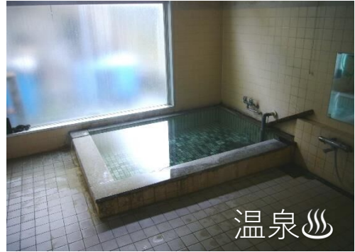
疲れを温泉で癒そう(男子風呂)