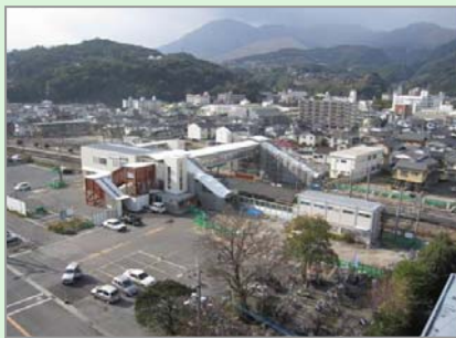
▲亀川駅周辺の市街地