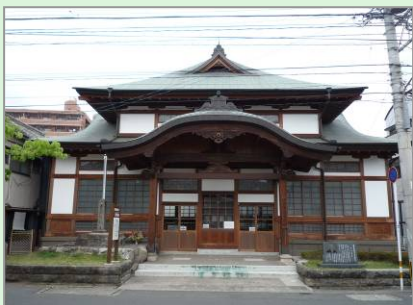
▲文化財の亀川浜田温泉資料館