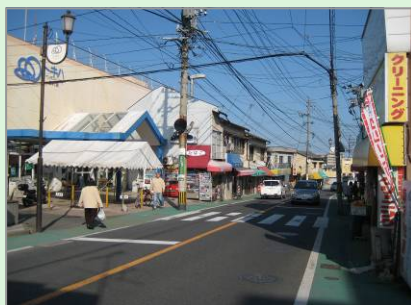
▲都市計画道路(上人ヶ浜湯の河線)