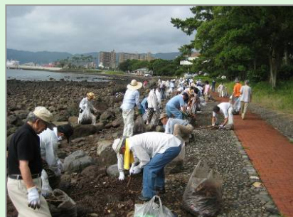
▲上人ヶ浜海岸での清掃活動