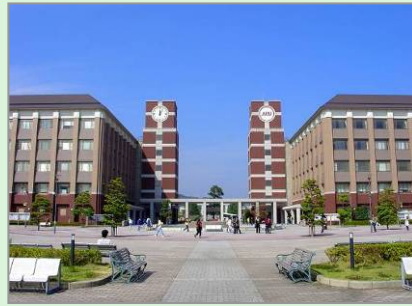
▲立命館アジア太平洋大学